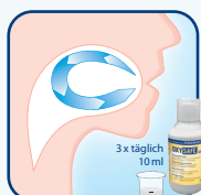
Fortsetzung der Behandlung durch den Patienten zuhause

Aktive Sauerstofftechnologie beschleunigt die Wundheilung (ohne Peroxid oder Radikale)