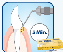
Direkte Applikation in die Zahnfleischtasche

Anwendung bei Parodontitis und Periimplantitis: Schnelle Reduzierung der Taschentiefe